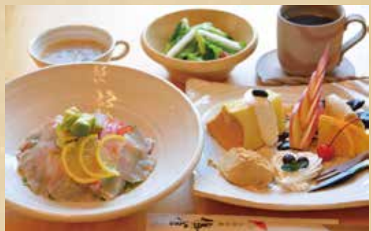
生ハムとアボガドのチーズごはん