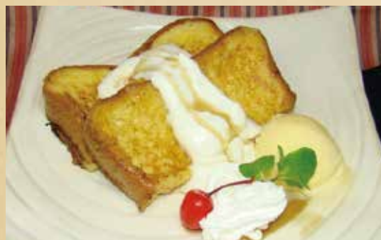
フレンチトースト