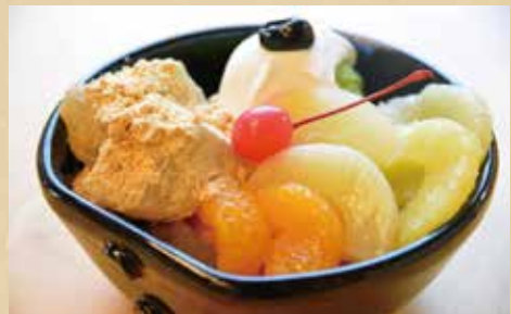
抹茶クリームあんみつ