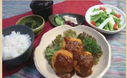
クリームコロッケ定食