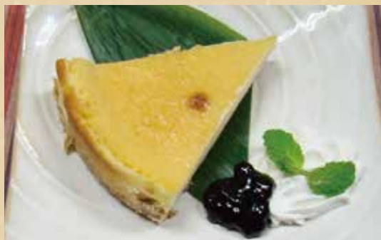
レアチーズケーキ