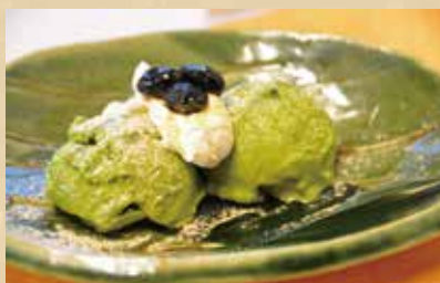
鎌倉アイス 460円(税込)