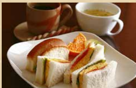
サンドイッチモーニング 500円 (税込)