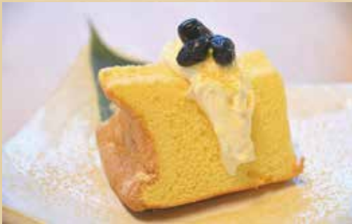
千姫の頬 500円 (税込) 【プレーン or 抹茶】 アイストッピング +100円 (税込)