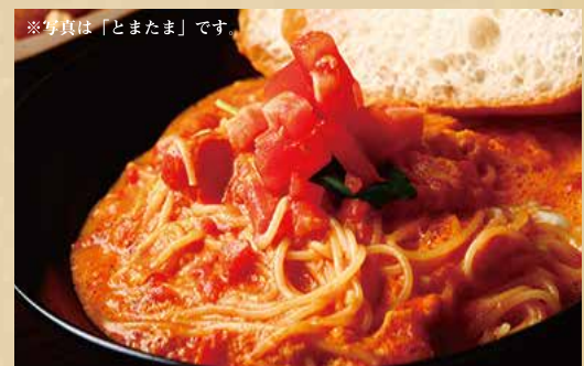
※写真は「とまたま」です

ニンニクと唐辛子の自家製オイルで作ったペペロンチーノを卵でとじたB級グルメパスタです。