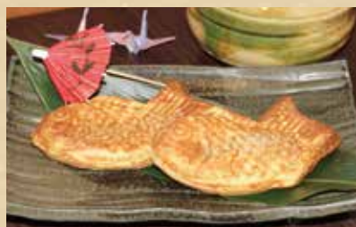
たいやき 400円(税込) 〈お抹茶セット〉750円(税込)