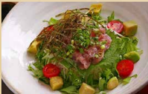
アボカド・ネギトロごはん 1,280円 (税込) 〈味噌汁 / サラダ / ドリンク / 日替わりデザートプレート付〉