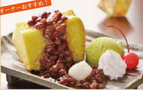
ゆずの月 700円 (税込) 〈ゆず茶セット〉 900円 (税込)