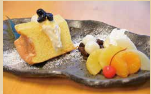
千姫の舞 780円 (税込) 【プレーン or 抹茶】