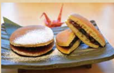
黒豆みかさ 420円(税込) 〈お抹茶セット〉770円(税込)