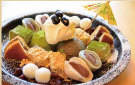
鎌倉贅沢パフェ 950円(税込)