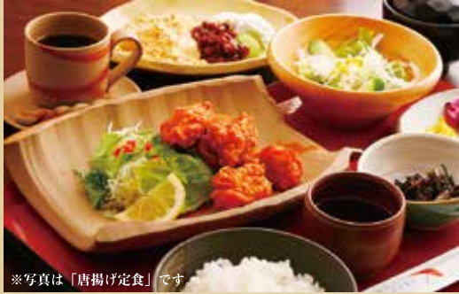
※写真は「唐揚げ定食」です