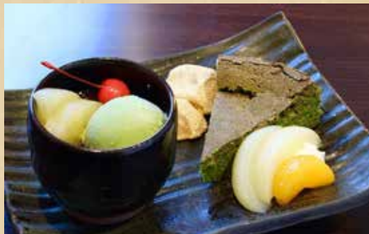
抹茶パフェ 780円(税込)