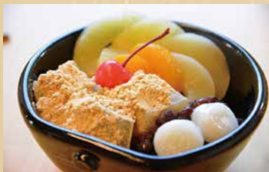
わらびあんみつ 600円(税込)