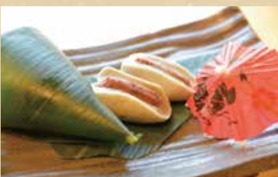
魅まんじゅう 360円(税込) 〈お抹茶セット〉710円(税込)