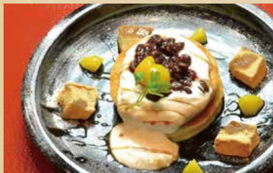
鎌倉パンケーキ 700円(税込)