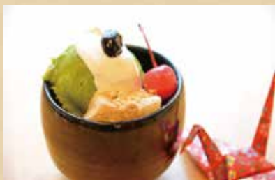
抹茶豆乳プリン 470円(税込)