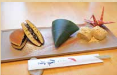
町家三昧 550円(税込) 〈お抹茶セット〉900円(税込)