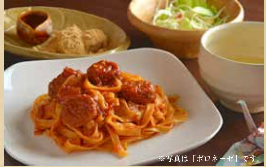
※写真は「ボロネーゼ」です