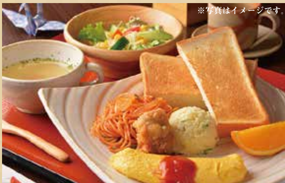
鎌倉モーニング 550円 (税込)