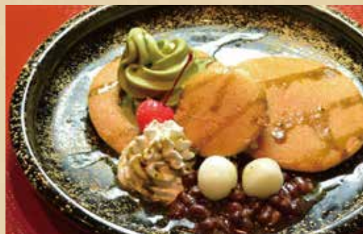
抹茶白玉パンケーキ 750円(税込)