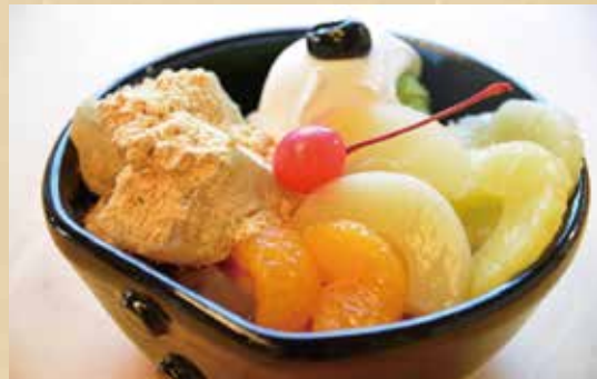
抹茶クリームあんみつ 650円(税込)