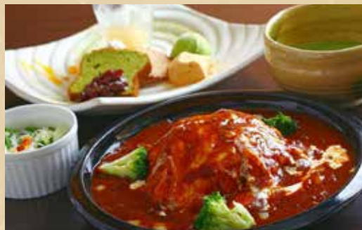
チーズオムライス 1,100円 (税込) 〈スープ / サラダ / ドリンク / 日替わりデザートプレート付〉 チーズハンバーグオムライス 1,280円 (税込) 〈スープ / サラダ / ドリンク / 日替わりデザートプレート付〉