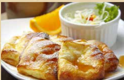
フレンチトーストモーニング 730円 (税込)