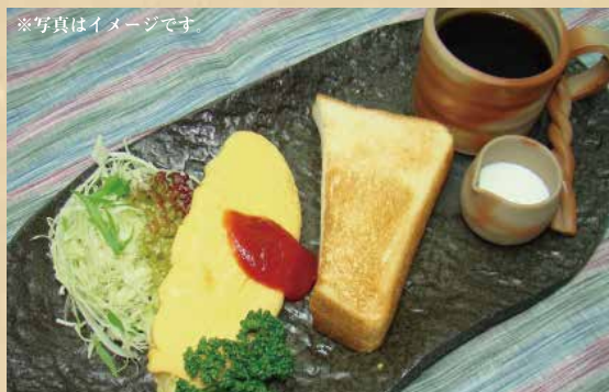
サービスモーニング 380円 (税込)