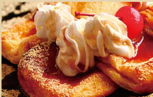
フレンチトースト 650円 (税込) 【メイプルシロップ or 黒蜜きな粉】