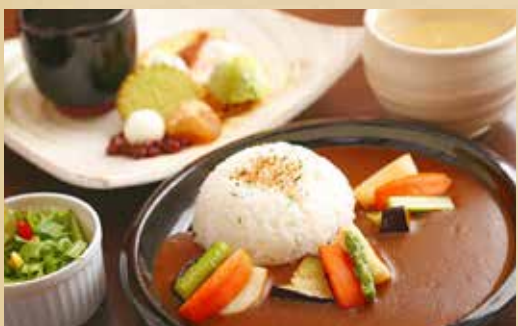
彩り野菜カレー 1,050円 (税込) 〈スープ / サラダ / ドリンク / 日替わりデザートプレート付〉