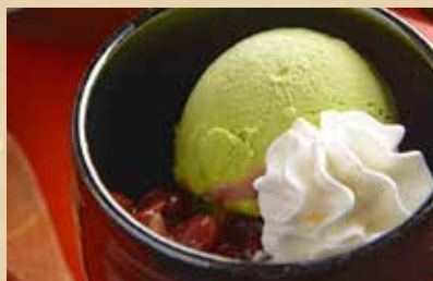
宇治抹茶のアフォガード 680円(税込)