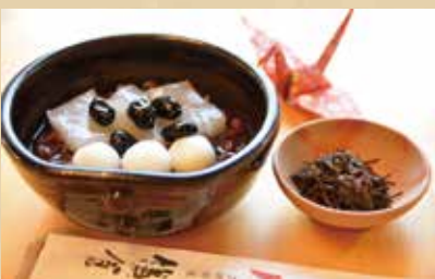
鎌倉ぜんざい【温 or 冷】 600円(税込) クリームぜんざい 700円(税込)