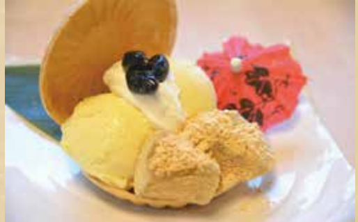
アイス最中 560円 (税込) 【きな粉バナナ or 抹茶 or 黒ゴマ】