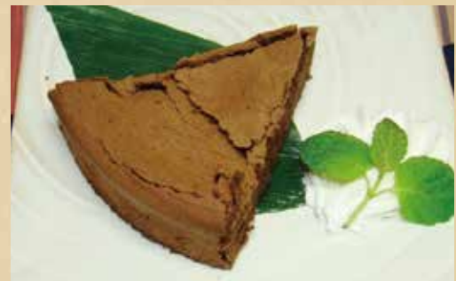
ガトーショコラ 470円 (税込) 【チョコレート or 抹茶】