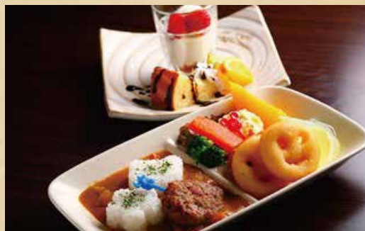
キッズプレート ※要予約※幼児限定 700円 (税込) 〈ドリンク / デザート付〉